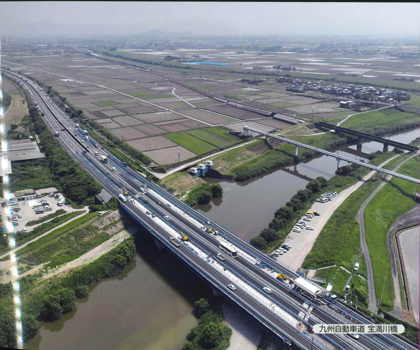
九州自動車道 宝満川橋